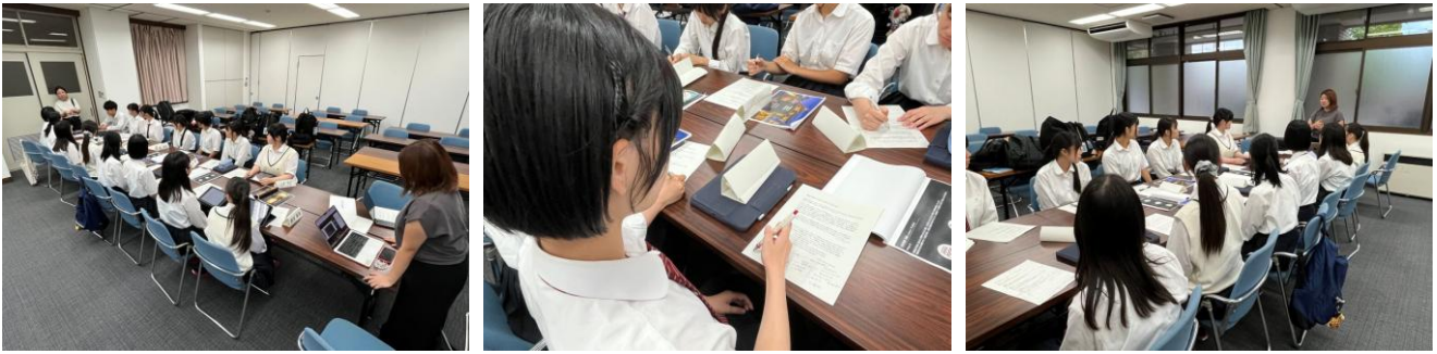
株式会社NAKED様との打ち合わせ