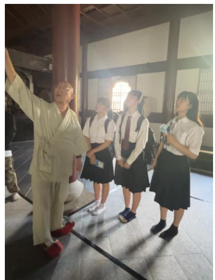
天龍寺のフィールドワーク