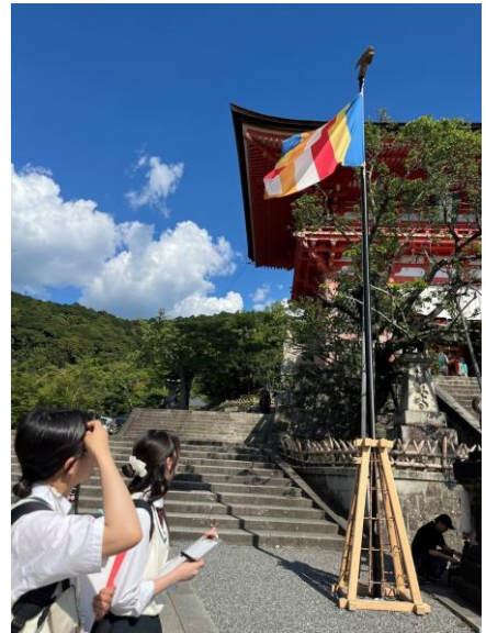
清水寺のフィールドワーク