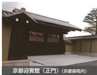
京都迎賓館〈正門〉(京都御苑内)

賓客の滞在中は、首脳会談、表敬訪問、署名式、レセプションや晩餐会など様々な公式行事が行われ、迎賓館はこれらの接遇を通じて、わが国外交の重要な一翼を担っています。